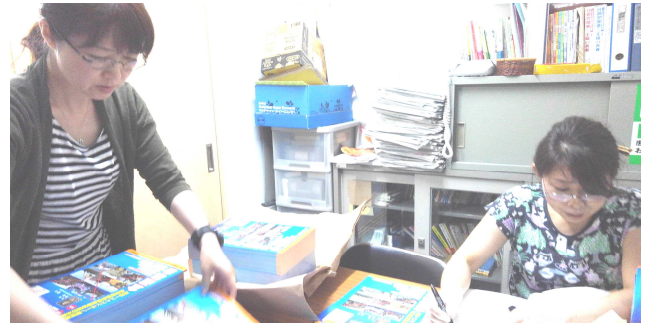
米海兵隊移転訓練反対集会のために奮闘する釧路連ショキース