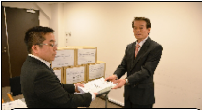
全教：教員免許更新制の即時廃止を求める署名提出と文科省要請 4/12